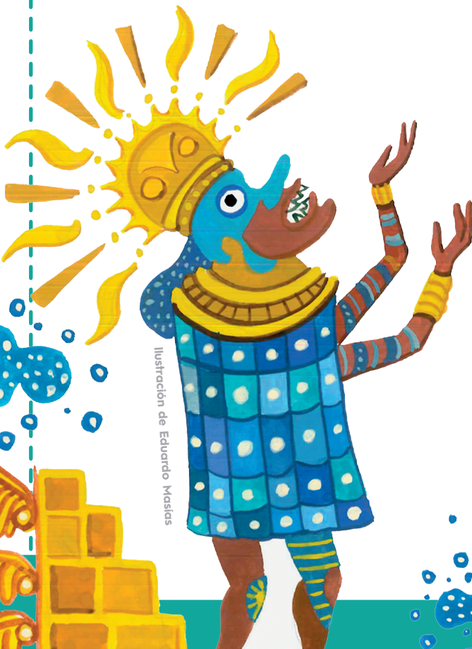
Ilustración de Eduardo Masías